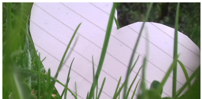
Fotó: Győri Kinga 7. a

Megértőn nézni a világra: Bocsásd meg azt, amiben gyarló, Ápold, kinek lelke árva, S örökre hidd: szép az élet, Hogy szeretni tanulj mindörökre, Hogy bocsáss meg minden embernek. Keresd a jót, kívánd a szépet! Lásd meg másban az emberséget!